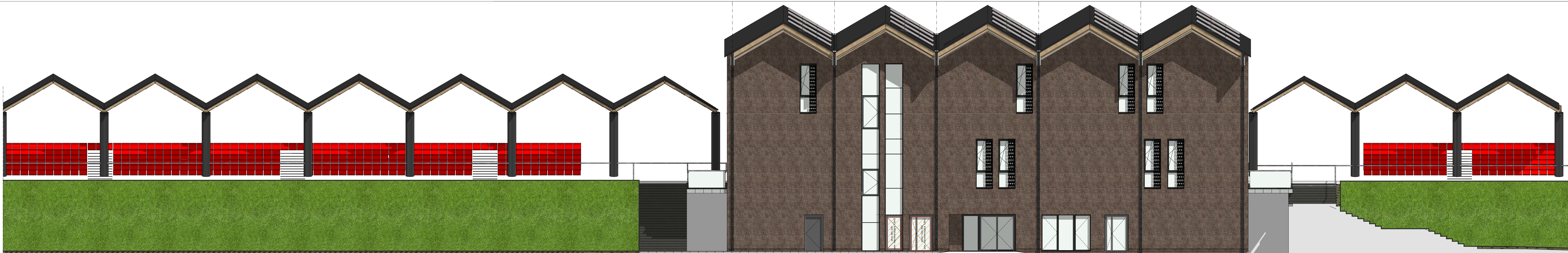
elewacja frontowa - południowa