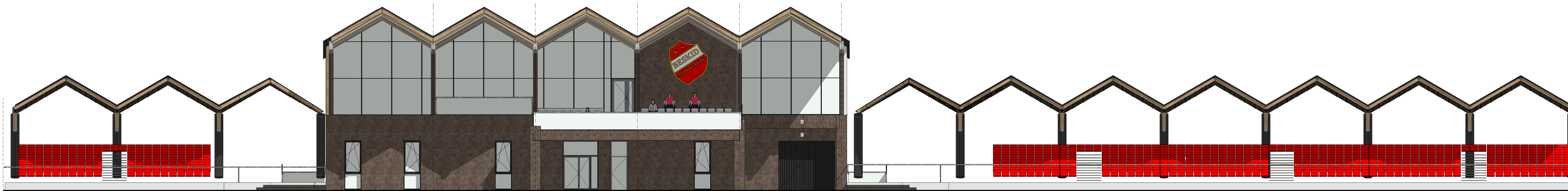
elewacja od strony boiska - północna